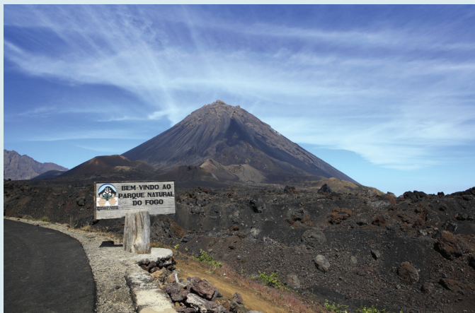
Pico do Fogo

Po pobycie na wyspie Brava (dzień 7–8) można wybrać bardziej klasyczny program zwiedzania na drugi tydzień. Warto połączyć pobyt w Mindelo na wyspie São Vicente z wędrówką szlakami na Santo Antão lub zdecydować się na tygodniowy odpoczynek na plażach na wyspach Sal i Boa Vista. Dwie ostatnie opcje: zob. „Wyspy Zielonego Przylądka w 1 tydzień”, s. 8.