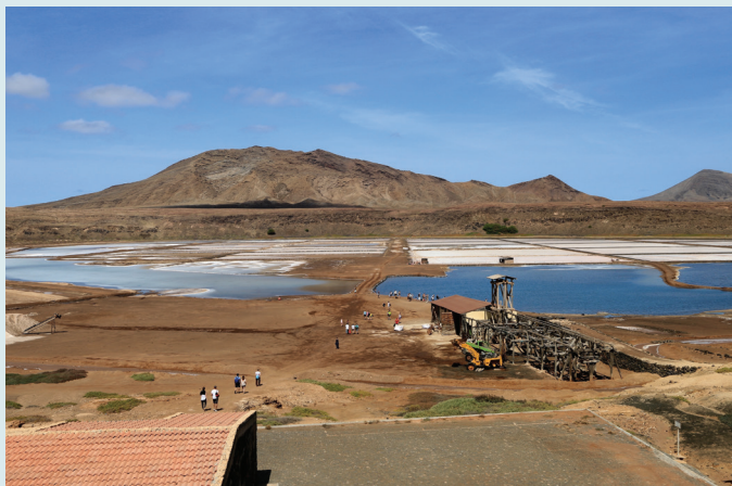
Pedra de Lume